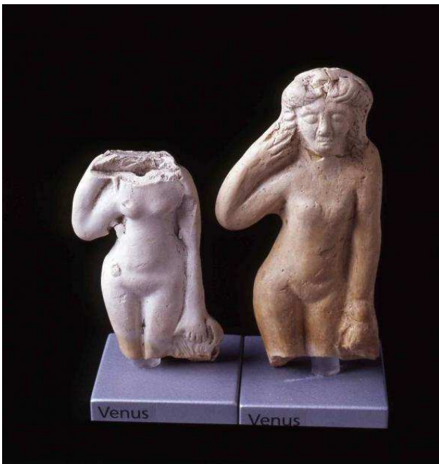
Statuen der Venus (römische Göttin der Liebe)