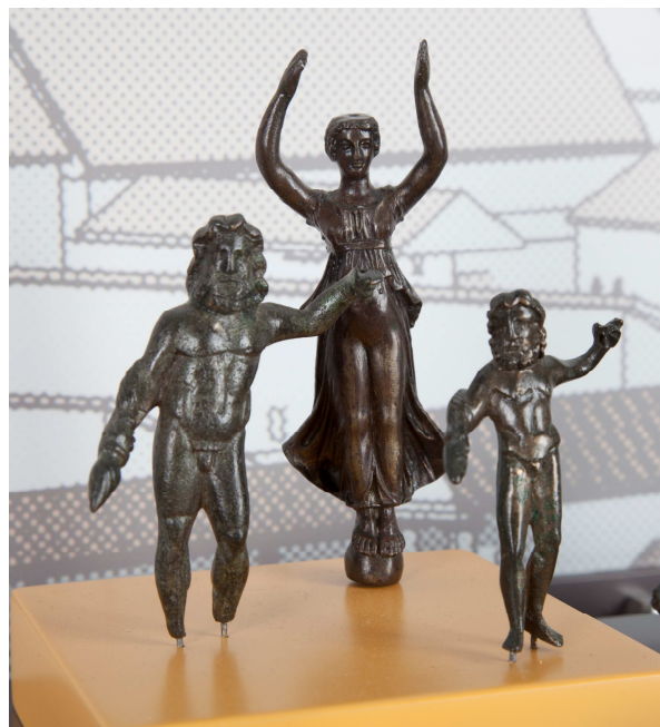
Statuen des höchsten römischen Gottes Jupiter (rechts und links) und der Siegesgöttin Viktoria (Mitte)

Zeichne eine der Götterfiguren in dein Heft.